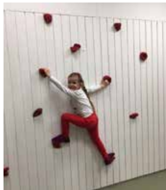
Spatzenkinder an der Kletterwand

„Mir alle freued uns drüber, weils cool isch und Schpass macht!“