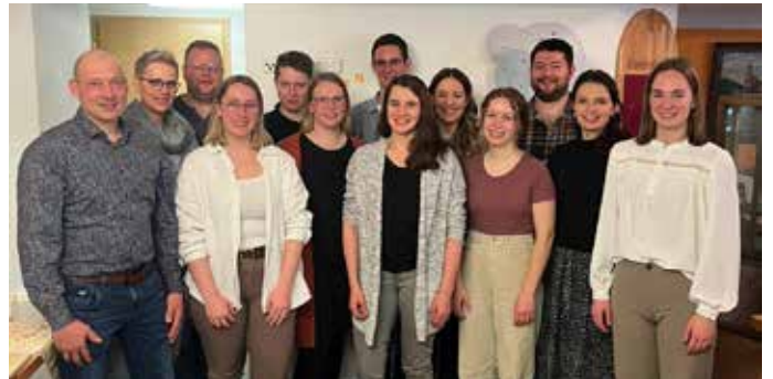
Ausschuss des Musikvereins und des Fördervereins

Die Generalversammlung ging harmonisch und ohne Wortmeldungen zu Ende.