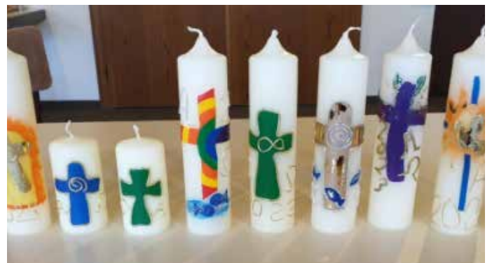
Gestaltete Kerzen einiger Teilnehmer aus dem Jahr 2023