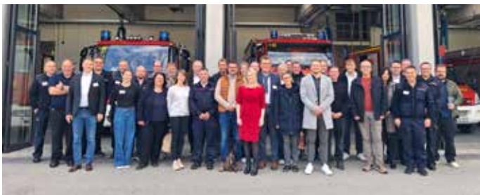
Foto Workshop vom 29.09.25

Infolge der Erderwärmung kommt es immer häufiger zu Extremwetterereignissen wie Unwettern, Starkregenereignissen, Hagel, Sturm, Hitze, Dürreperioden. Wie zuletzt beim Zugunglück in Zell-Bechingen haben Extremwetterereignisse oft dramatische Folgen. Und wie im Fall der Flutkatastrophe im Ahrtal vor vier Jahren können sie auch die Infrastruktur zerstören. Gleichzeitig bergen die aktuellen internationalen Krisen erhebliche Risiken, mögliche gezielte Sabotageakte auf die Infrastruktur sind eine ernst zu nehmende Gefahr geworden. Um auf Krisen- und Katastrophenfälle vorbereitet zu sein, hat das Landratsamt die Kampagne ‚Krisenfest‘ gestartet. Sie umfasst neben Vorbereitungen im eigenen Haus und in Zusammenarbeit mit den Kommunen auch Empfehlungen für die Bevölkerung.