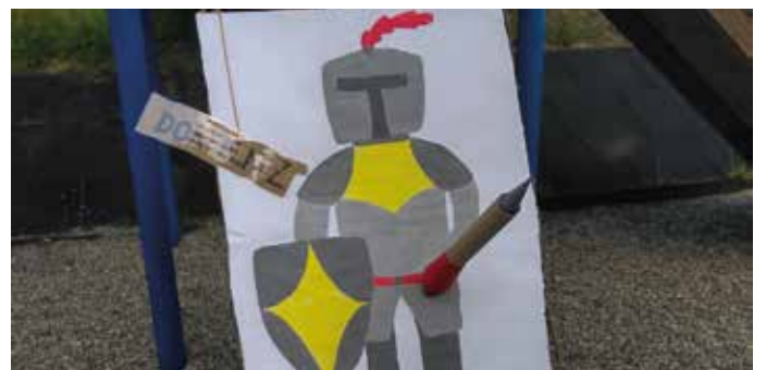
Vorschulabend Burg Spatzennest

Am langen Vorschulabend genossen die Sonnenkinder noch einmal, wie von Ihnen gewünscht, unser Jahresthema „Mittelalter“! Um 18:00 Uhr öffnete Burg Spatzennest seine Tore für Ritter, Prinzessinnen und Drachen! Das große Mittelalterturnier startete nach dem Anmalen der Laufkarten des Turnierplanes mit einzelnen Prüfungen und der Geschichte vom Kaugummiblasen und dem Drachenkönig. Als erstes musste der ritterliche Turnierpferdeparcour bewältigt werden. Dann ging es mit dem Apfelschnappen, dem Ringwurf, dem Dreibeinlauf, dem Sackhüpfen und dem Katapult schießen weiter. Da Ritter, Drachen und Prinzessinnen auch mal eine Stärkung benötigen, wurde gemeinsam Ritterpizzafaden gegessen! Gebastelt wurden Ritterhelme, Prinzessinnenhüte, Zauberspiegel, und Katapulte. Bei unserer Schatzsuche rund um den Kindergarten tief in der Nacht, beantworteten die Kinder Märchenfragen. Die Schatztruhe öffnete sich nur beim richtigen Beantworten der Fragen. Das Eis und die Drachengrütze wurden genossen und verspeist! „Des Apfelschnappen und der Dreibeinlauf war soo witzig, gebaschtelt und Schatzsuche ham wir auch gmacht!“ „Der Schatz war lecker!“