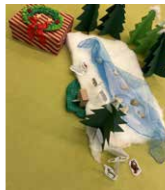
Weihnachtszeit im Winterwald

Die Kinder vom Spatzennest hören jeden Tag im Morgenkreis gemeinsam eine neue Geschichte von der Weihnachtszeit im Winterwald. Jeden Tag wird ein Kind mit dem rollenden Musikball gezogen, wer die wandernde Adventskiste mit nach Hause nehmen und diese mit der Familie genießen darf, sowie wer einen kleinen Weihnachtsengel geschenkt bekommt! Plätzle dürfen auch genascht werden! „Mir händ mit de Mamas im Stüble Plätzlt backa dürffa! Da hand ma au Weihnachtsmusik hera dürffa ond vom Teig gnascht!“ „Des war echt toll, alle händ mitgmacht!“ „Wir naschen die Plätzchen im Morgenkreis, oder in der Adventsstunde im Stüble!“ „Auch schmecke dia immer, wenn alle zamma sind!“ „Dahoim hamma des Kischtle uff gmacht, alles aufbaut, des Licht, dia Serviette, dia Deko, de Tee gmacht, dia Gschichta glesa, alle zamma! Mama hod di Weihnachtsgschicht glesa, sooo schee wars mit alle zamma!“