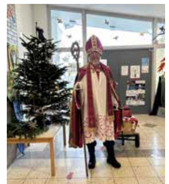
Der Nikolaus ist hier, schon kommt er durch die Tür...

Am Nikolaustag drückten sich die Kinder immer wieder die Nasen an der Fensterscheibe platt. „Wann kommt der Nikolaus?“ „Weiß der, dass mir net im Wald, sondern im Kindi sind?“ „Hod der eusre Bilder und Froga in de Socke entdeckt, dia mir für Ihn gmolt ond gschriba händ?“ „Wann kommt der denn endlich?“ „Hod der eus vergessa?“ „Der echte Nikolaus vergisst euch nicht, ganz bestimmt nicht!“ „Do isch er!“ „Da untem aufm Weg, da isch er!“ Alle Kinder standen winkend und rufend an den Fenstern bis er endlich den langen Weg durch Wind, Regen und Graupel mit dem weihnachtlich geschmückten und Glöckchen klingelnden Bollerwagen, ziehend an unsere Kindergartenertür ankam. „Mit einem Liad ham wir den Nikolaus