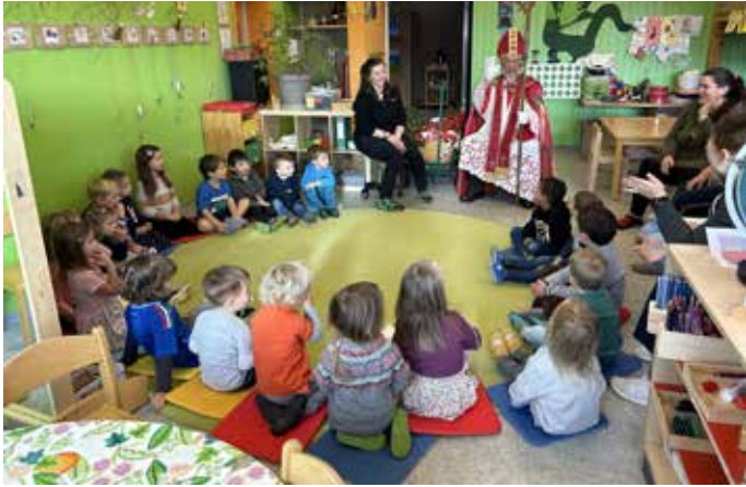
Der Nikolaus bei uns im Morgenkreis...

begrüßt, der hod sich gfreit!“ „Der Nikolaus hat einen Bischofstab an der Hand gtragen, weiße Handschuh hat er ankapt! an roter Mantel, die Mitra, schwarze Stiefel, ond den Bollerwaga zogo hod er!“ „Am Bollawaga wared lauter Glocka, Sterne, Zweige, ein roter Sack ond des goldene Buch, do hod er dann eusre Froga ond Bilda drin kett!“