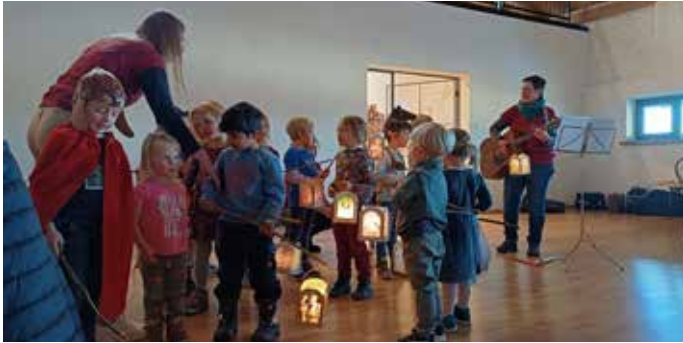
Die kleine Gruppe der Naturkinder