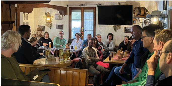
Als Abschluss der zweitägigen Ausfahrt wurde in einer Besichtigung mit Führung die Insel Reichenau näher erkundet.