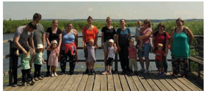
Ausflug der „Sternen-Kinder“ zum Federseesteg Bad Buchau

„Zum Ausflug auf den Federseesteg gegangen sind die mutigen Sterne, die Jüngsten in weite Fernen!“ „Schwäne und Fische wurden entdeckt, sowie das eine und andere Insekt! An erster Stelle ist doch klar, stand das gemeinsame Erleben von Freude, hurra!“