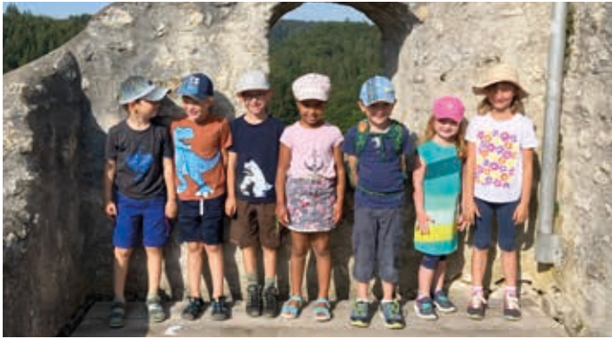
Ausflug der „Sonnen-Kinder“ auf Burg Derneck bei Münzdorf

„Das Suchen von Wurzeln, Kräutern und Pflanzen, ließ die Mädchen mit Kranzen aus Blumen tanzen!“ „Erobert mit wildem Hurra wurde der Spielplatz, wie wunderbar!“