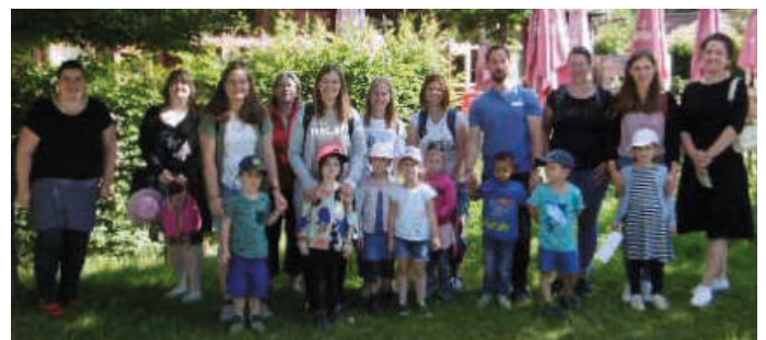
Ausflug der „Mond-Kinder“ nach Kürnbach ins Oberschwäbische Museumsdorf

„Gemeinsam auf dem Spielplatz hatte Freude im Spiel dann auch jeder Spatz!“