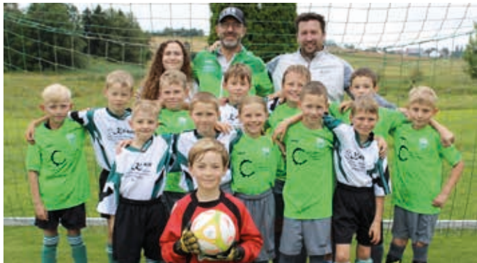
Die F-Jugend der Eintracht Seekirch

in der darauffolgenden Siegerehrung über Preise, gesponsert von der Schussenrieder Brauerei, freuen. Wir bedanken uns bei allen Teams für die rege Teilnahme am Turnier, aber auch bei allen fleißigen Helfern und Mitwirkenden, insbesondere unseren Schiedsrichtern, die zu einem reibungslosen Ablauf des Fit & Fun Turniers beigetragen und dieses erfolgreiche Wochenende mitgestaltet haben. Ein besonderer Dank geht an die Firma May aus Betzenweiler, die uns dieses Jahr zwei große Sonnenschirme zur Verfügung gestellt hat.