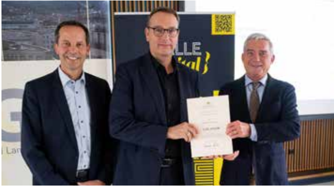
Übergabe des Breitbandförderbescheids durch Digitalminister Thomas Strobl und Thomas Dörflinger, MdL