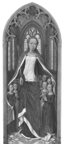
Hans Memling: Ursulaschrein, Hl. Ursula und Gefährtinnen

Gedenktage: 21. Oktober – Patrozinium der Pfarrkirche St. Ursula, Dieterskirch