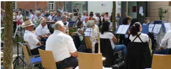
Zahlreiche Besucher beim Vereinsjubiläum der Bürgergemeinschaft Schlosshof