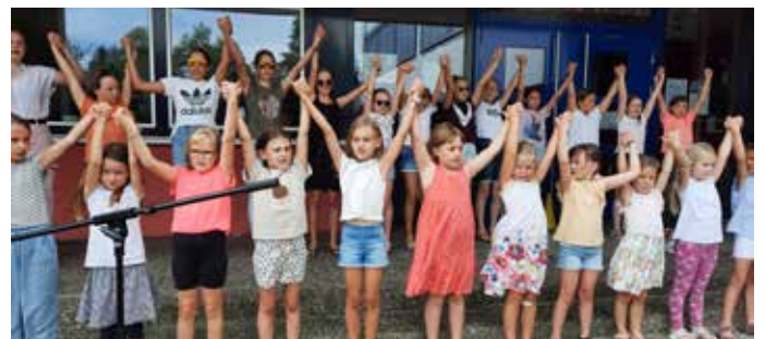
Finale – Best of us