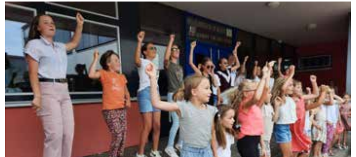
Ram PaPaPam Pam Pam Pam – Partyplanet

17.-19.11.2023 Chorsemnar, Landesmusikakademie Ochsenh.