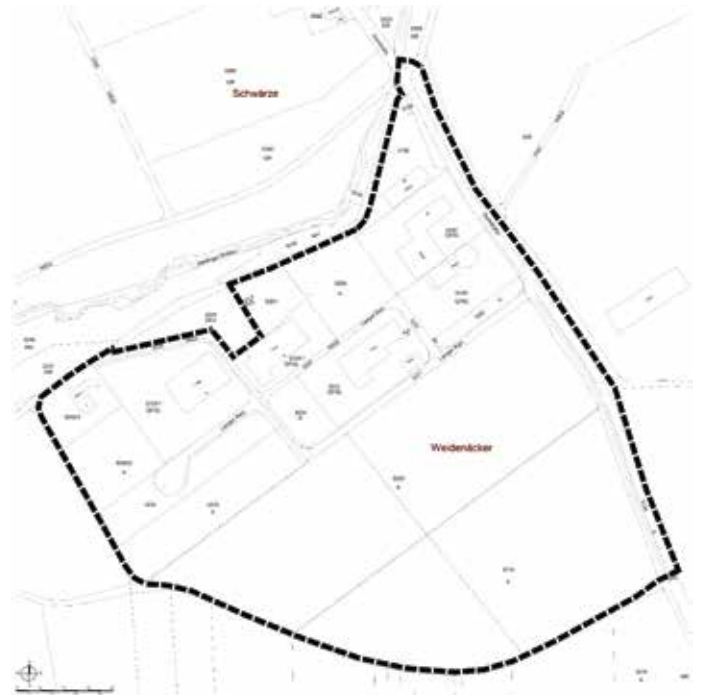
Abgrenzung Bebauungsplan „Gewerbegebiet Denting“ (Abbildung ohne Maßstab)

rere Firmen und auch ein gemeindeeigenes Wirtschaftsgebäude, welches der Bauhof nutzt. Der nördliche Bereich des Plangebietes ist bereits überwiegend bebaut. Als neue gewerbliche Bauflächen werden insbesondere die Flst. Nr. 3220 und 3219 in den Umgriff des Bebauungsplanes aufgenommen. Die Erschließung des Baugebietes ist ebenfalls bereits größtenteils hergestellt. Innerhalb des Geltungsbereiches des Bebauungsplanes ist auch die Gemeindeverbindungsstraße, die in diesem Zuge ausgebaut wird. Die Größe des räumlichen Geltungsbereichs umfasst in dieser Abgrenzung ca. 13,80 ha. Das Plangebiet wird wie in der nachfolgenden Abbildung dargestellt abgegrenzt: