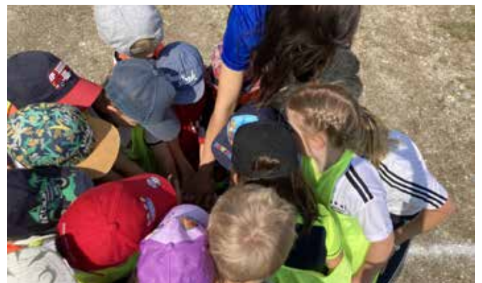
Teamfoto! „Wir sind mutig, wir sind stark, wir sind die Kinder vom Spatzennest, hurra!“

„Wir haben jetzt eine schöne Eisdielen“ „Da kann man Eis kaufen aus Sand!“ „Das schmeckt sehr lecker, das Eis im Sandkasten!“ „Mir müssen es herstellen!“ „Da gibt's Erdbeer, Zitrone, Melone und Schokolade!“ „Manchmal machen wir auch noch Vanille dazu und es gibt Streuigel und Pfefferminz dazu!“