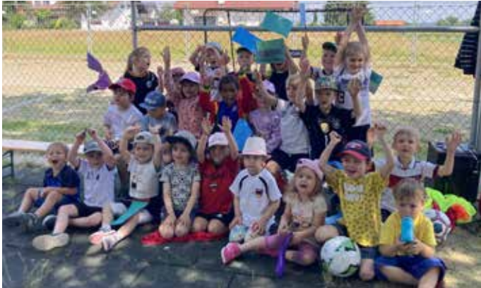
„Die Fußballtage waren Super!“

„Am Ende haben wir noch ne Fußballreihe gemacht und jedes Kind wurde aufgerufen und hat eine Medaille bekommen und die anderen haben geklatscht!“ „Das war echt toll!“