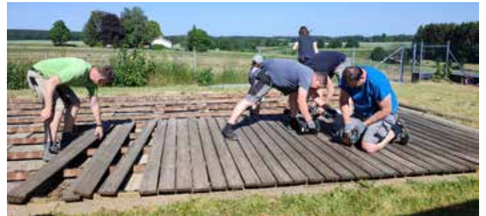
Papas in Aktion!

Die Spatzenkinder berichten im Morgenkreis von der Helferaktion der Papas, unserem Eisladen im Sandkasten und unseren Fußballtagen im Kindergarten!