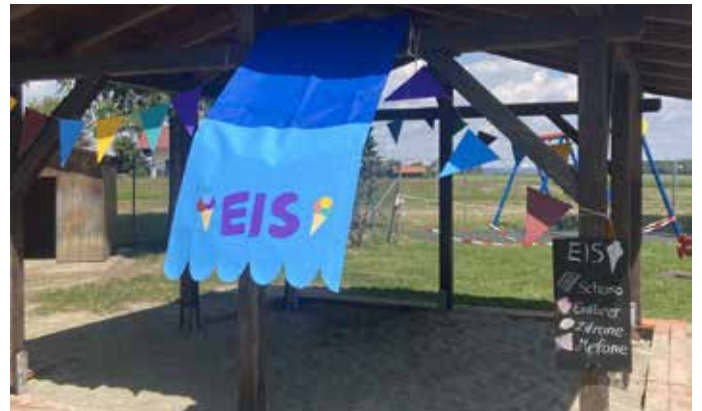
Unser Eisladen im Sandkasten!

„Da ham die Papas Bretter aufgeschraubt mit dem Akkuschrauber und durchsägt in der Mitte.“ „Die Erzieherinnen hend dia Bretter dann ufgräumt. Der Bauhof hod se dann abgeholt!“ „Da kommt mehr Gras zum Spiela hin ond nen Hasastall für unsre Kindergartenhasa!“ „Juhu!“ „ Mir freued uns scho!“