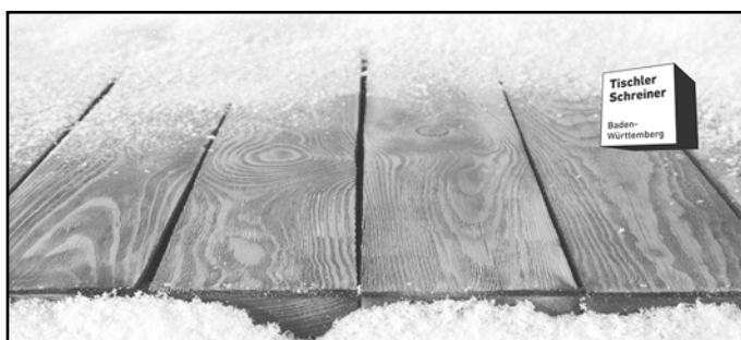
Tischler Schreiner Baden- Württemberg