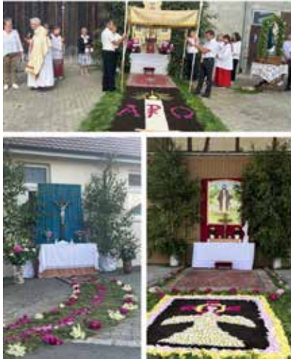
Sauggart: Bild 1 Fam. Blersch, Bild 2 Fam. Moll, Bild 3 Fam. Locher