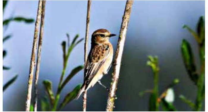
Ein äußerst seltener Gast, das Braunkehlchen: Vogel des Jahres 2023